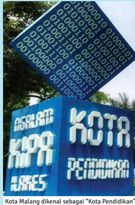
Kota Malang dikenal sebagai "Kota Pendidikan"

Indonesia City Expo ke-15 Tahun 2017 akan diselenggarakan pada tanggal 12- 16 Juli 2017 di Stadion Gajayana Kota Malang dengan luas pameran sebesar 6800 m 2 dan diikuti oleh Pemerintah Kota, Pemerintah Kabupaten, Pemerintah Provinsi, BUMN, BUMD, Perusahaan Swasta Nasional, UMKM, Institusi pendidikan serta sektor informal akan berpartisipasi dalam kegiatan ini. Rangkaian kegiatan pendukung RAKERNAS APEKSI meliputi: Indonesia City Expo 2017, Pawai Budaya, Penanaman Pohon Khas Kota Anggota APEKSI, City Tour, Ladies Program, Pertunjukan Seni Budaya, Pertunjukan 7D, Arena permainan anak "Bouncy", Festival Kuliner dan Pemilihan Stand Terbaik.