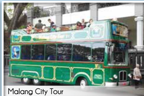
Malang City Tour