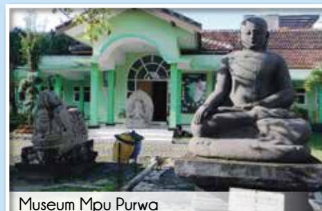
Museum Mpu Purwa