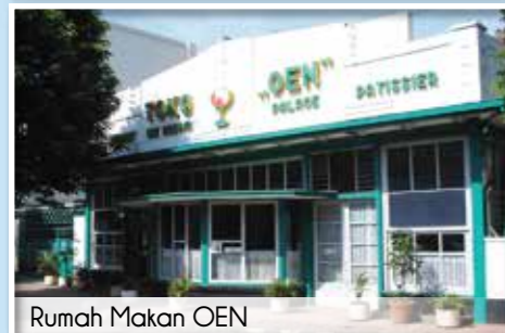
Rumah Makan OEN